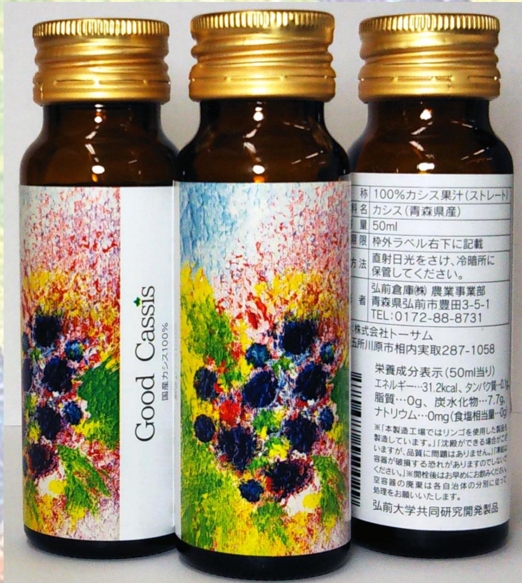
写真: Good Cassis® 100%カシス果汁(ストレート) 50ml入

※パッケージコンセプトは飲んだ際に感じる「27℃の心地よい風が体を吹き抜ける爽やかさ」をイメージ